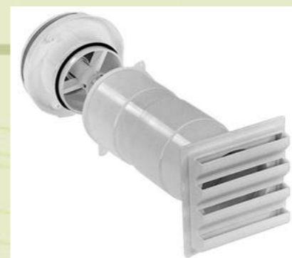
Приточные, вытяжные клапаны, вентиляторы